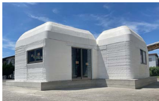
完成した3Dプリンター住宅

価格も一般的な戸建てに比べるとかなり安いことがわかりますが、それよりも驚くことは、施工期間の短さです。50㎡の1LDK規模の戸建てが、内装や設備工事を除く外観部分だけで約2日間と完成となるようです。また、その際に工事に携わる人員も大幅に削減できることから、人件費を抑えられるため、今後の建築業界が大きく変わっていくことが予測されます。